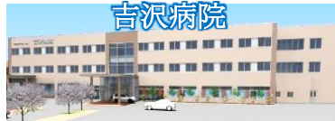
《医療・介護・健康》